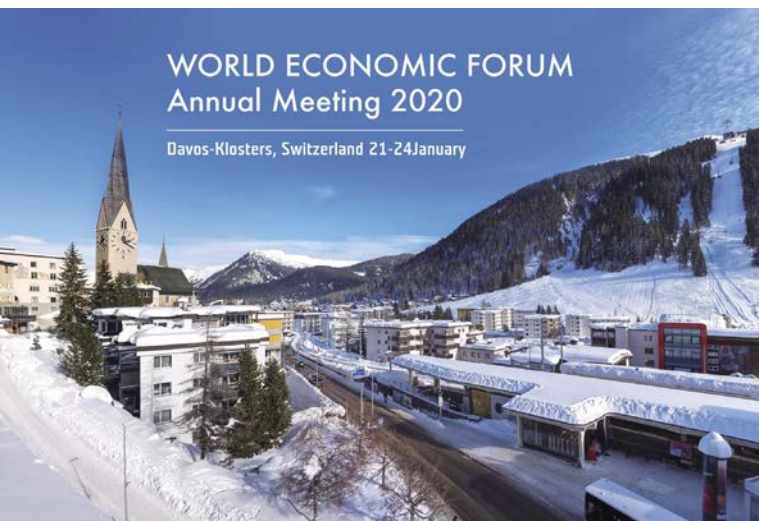
2020年元月WEF在冰天雪地的瑞士召開大會，表示氣候變遷將成為衝擊全球穩定的風險來源。

全世界最大的投資管理公司貝萊德（BlackRock），其總裁勞倫斯·芬克（Laurence Fink）每年初都會寫一封公開信給相關行業的CEO，說明未來整個集團的投資政策與重點方向。各產業都不敢輕忽這封信釋出的訊息，因為公司的經營若與其相違背的話，恐怕得不到貝萊德的投資。已經被貝萊德投資者，也可能被釋出。2020年1月芬克總裁的公開信中只有一個議題，那就是氣候變遷危及全球，金融業無法置身事外。