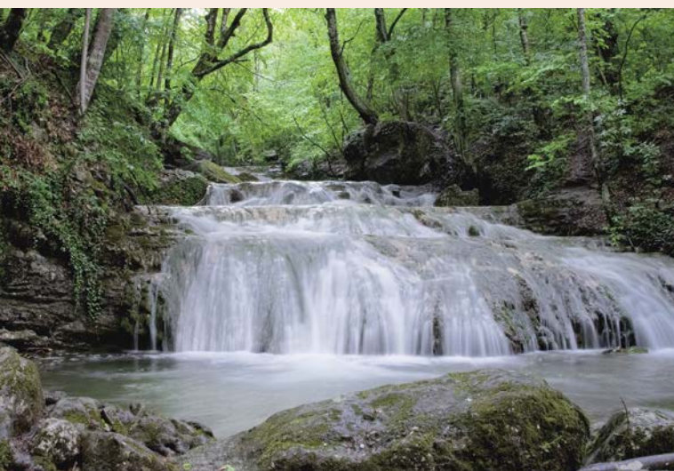
水質保護、清潔的能源、負責任的生產及消費與氣候行動等永續發展指標不僅能看出企業的努力誠意，也是國際關注的焦點。

台灣在2014年開始要求股本100億元以上的上市櫃公司，必須編製其企業社會責任報告書，公開該公司在環境、社會及公司治理等各面向之指標，讓社會各界對其營運狀況有更深入了解。另為回應社會對食安、石化業環保與金融消費議題的重視，這三種產業則無資本門檻限制，只要是上市櫃公