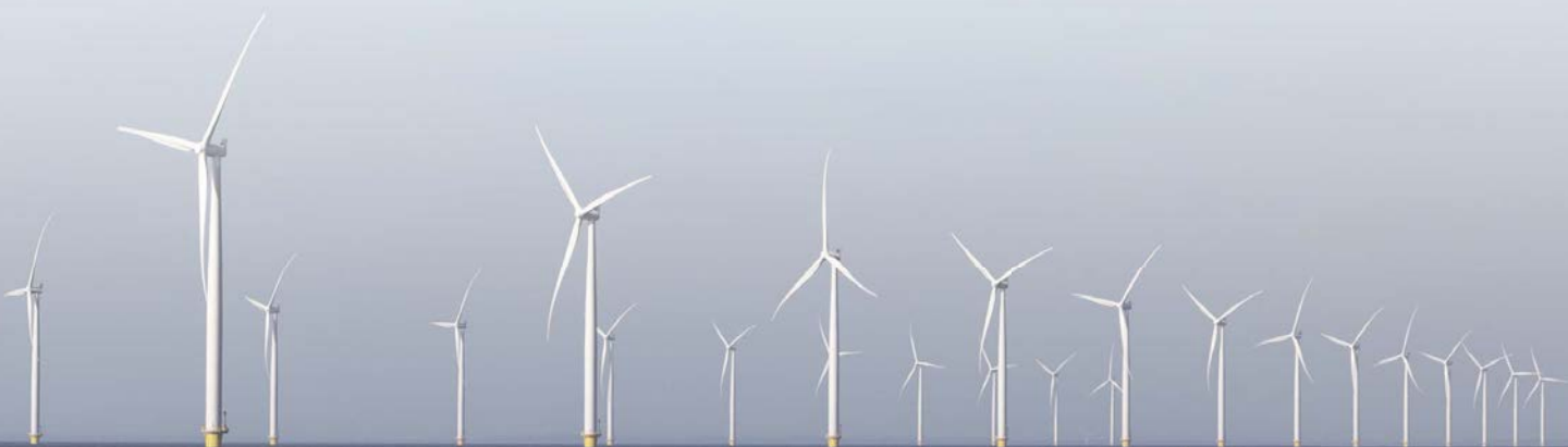
發展離岸風電為目前台灣最重要的再生能源政策，其成功關鍵因素即為必須建構專案融資完整網絡關係及提供多元的籌資管道。

發展離岸風電專案的關鍵成功因素，即為建構離岸風電專案具有強化專案信用的專案融資完整網絡關係〔如圖1〕，及提供具有初級市場與次級市場的多元籌資管道；首先是建構專案融資完整網絡關係，離岸風電專案融資為無追索權融資方式，唯一的還款來源，是從離岸風電專案開始營運後產生現金