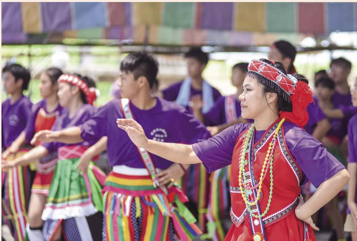
台灣金融研訓院與介惠慈善基金會實地訪察了解原鄉婦女的財務處境，後續則協助介惠照服員能夠自立滿足生活所需的財務需求，增強面對風險的自信準備。

女因擔任照服員逐漸可以穩定家庭經濟，但距離財務健康仍然相當遙遠，台灣金融研訓院表示，逾8成照服員的財務觀念與能力有待提升。這項合作計畫為期2年，第一年聚焦在教練與輔導的陪伴訓練，第二年則持續追蹤受訓者的目標達成狀況，加強金融專業諮詢的介入，協助介惠照服員能夠自立滿足生活所需的財務需求，並對於生命中可能面對的金融風險有所自信準備。