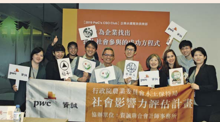
資誠PwC台灣協助行政院農委會水土保持局製作「蘭編共同工作空間 - 蘭草愛好者的社群平台」和「求海人尋滬誌」兩份報告，雙雙獲得國際社會價值協會認證！

在永續發展蔚為風潮的當下，儘管企業和非營利組織的公益專案琳瑯滿目，利用衡量基準的統一，可以讓捐助者、決策者與受贈者等利害關係人，透明掌握投入的每一份心力如何運用在更好的地方，槓桿出最大的影響力！