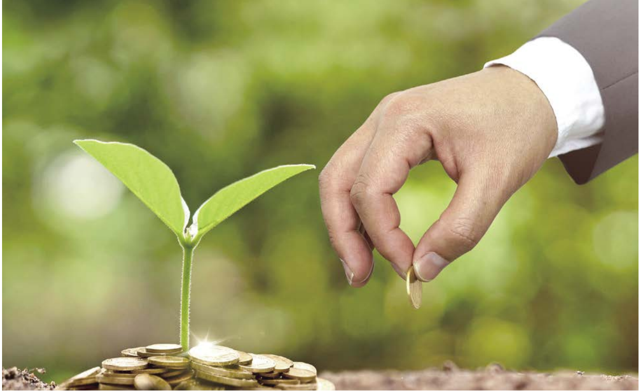
臺灣發展綠色金融不遺餘力，金管會持續推動綠色相關行動方案，為臺灣的永續發展盡一份心力。

牌制度。其資金用途主係投資於再生能源及能源科技發展（包括離岸風電、太陽光電或水力發電廠建置等）、溫室氣體減量、能源使用效率提昇及能源節約等綠色投資計畫。另為持續發展臺灣綠色債券市場，並鼓勵企業落實企業社會責任，公司治理中心於2018年將公司對綠色債券的投資或發行列入公司治理評鑑之加分項目，以提高企業發行或投資綠色債券之誘因。統計2019年度共發行14檔，實際發行金額共計約502億元，累積已發行1,041億元。