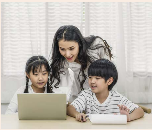
台灣金融研訓院認為，金融素養應是一門系統性的終生訓練項目，每個人所需的訓練內容會因本身的環境條件而異。（圖／達志影像）

經濟合作暨發展組織（OECD）研究指出，國民的金融知識水準（亦稱金融素養）是國家經濟社會振興的必要條件。因此，近年來各國已將提升國民金融識字率與推動普惠金融視為優先政策。消費者如能具備財務意識，不僅能夠在運用金融商品時做出明智的選擇，或是做出合理的財務決策，更可透過更好的財務計畫來照顧自己的未來，這是每個人畢生都必須持續學習的生活技能。