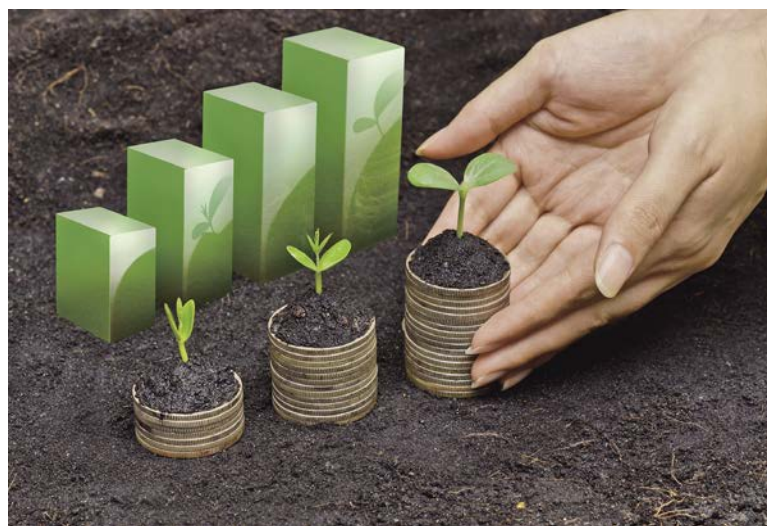
現有經濟體系主要是在資源有限的世界裡，以追求無限成長為目標。企業和大眾都應該重新省思這樣的作法對地球環境所造成的傷害，並盡力改善。

從國際上觀察，有越來越多主權財富基金也意識到，若以油氣類股投資為主要收益來源，未來恐將面臨長期財務風險。其中，全球最大政府主權基金——挪威主權財富基金決定逐步出售許多石油及天然氣公司的持股，凸顯靠投資石油致富的主權基金也注重永續