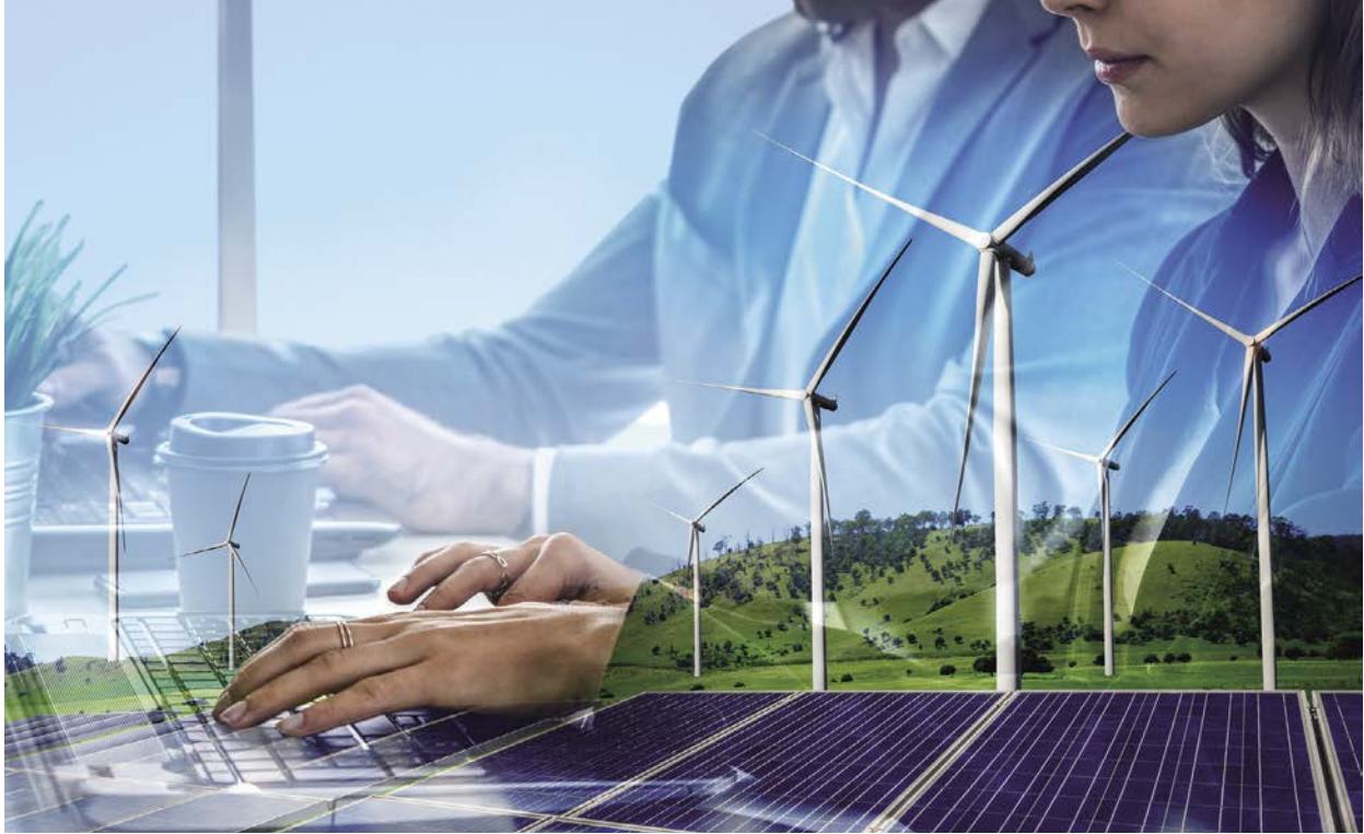
氣候變遷受到國際社會高度關注，支持環境永續發展，並將融資對象的環境和社會風險納入考量，成為投資決策的責任投資原則。(圖/達志影像)

示，美國SRI規模從2016年的8.72兆美元快速成長至2018年的12兆美元，成長38%，約每4塊美金有超過1塊美金是根據社會責任投資原則在投資，顯示投資人越來越重視責任投資。