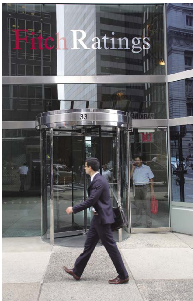
知名信用評等機構不受任何國家左右，有時影響力甚至強大到可以匹敵國家。