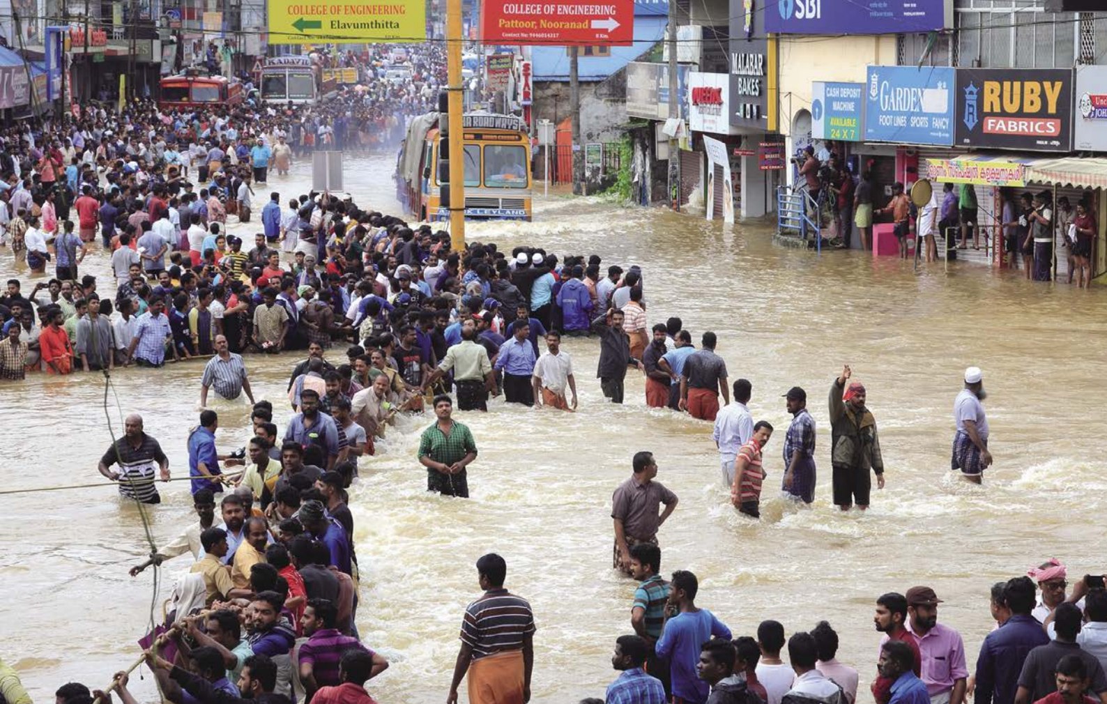
極端天氣事件已成為對全球穩定的最大威脅，造成許多生命及財產的損失。

球前20名，極易成為國際課責的對象。因此企業不但要做好減碳工作，也應做好相關資訊的揭露，做好社會溝通的工作，讓各界知道台灣企業減碳的努力與誠意。