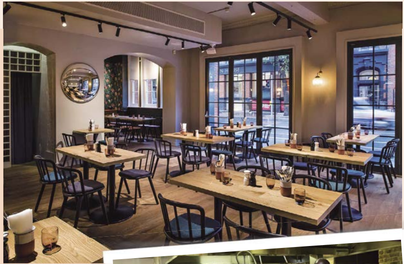
資誠PwC結合英國家庭與社區公部門以及公益團體，成立公益餐廳，幫助街友開啟新生活。