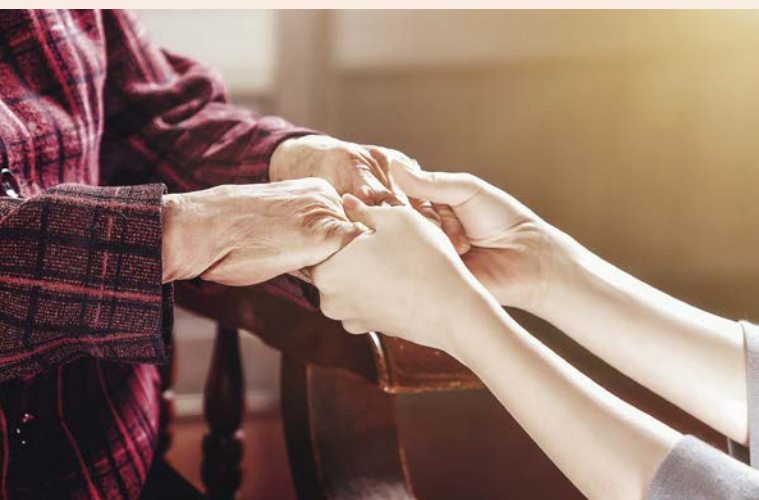
重視ESG概念的企業，基本上會擁有相對透明且有可信度的財報、相對低風險的營運表現，更值得投資者信賴。（圖／達志影像）

以往，投資人在評估一家企業是否有投資價值時，通常只會檢視其財報，以營收、獲利、毛利率等數據來判斷是否值得投資。但是，納入ESG的考量後，投資人所評估的項目，勢必延伸至各種影響公司未來發展的「非財務因子」。