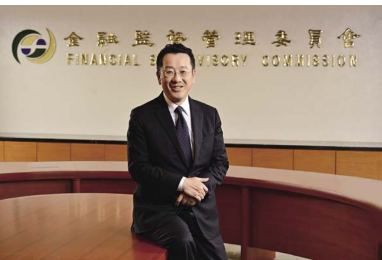
金管會主委顧立雄積極宣導企業善盡企業社會責任，並揭露ESG相關資訊，以供投資人參考。

這顯示全球責任投資持續成長，依據全球永續性投資聯盟（GSIA）之研究，全球社會責任投資（SRI）規模自2016年之22.89兆美元成長至2018年之30.683兆美元，成長率達34%。另據社會投資論壇（SIF）的數據顯