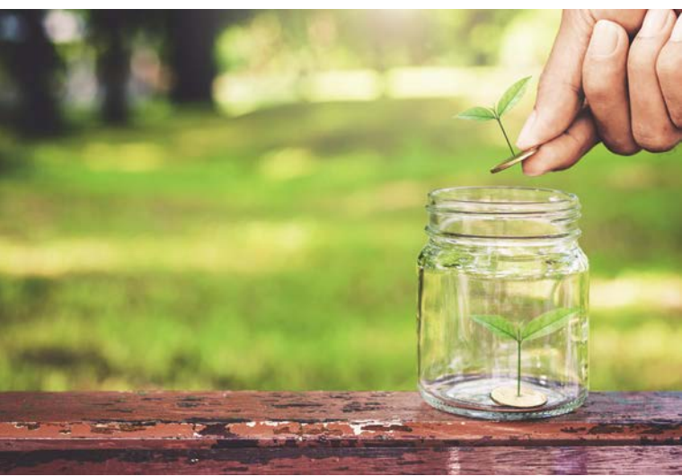
台灣投資者對於ESG的支持與肯定，讓ESG相關投資商品有極大的市場潛力。

從該商品在2019年8月23日問世之後的多項數字，都可看到ESG的ETF在臺灣市場短短半年內，已掀動一波投資熱潮，對此元大投信主管指出，不論是從掛牌價格、基金規模的成長與速度，以及投資人次、投資人類型等，這些現象不僅讓元大投信團隊發現台灣投資者對於ESG的支持與肯定，同時也發現這類型商品有極大的市場潛力。