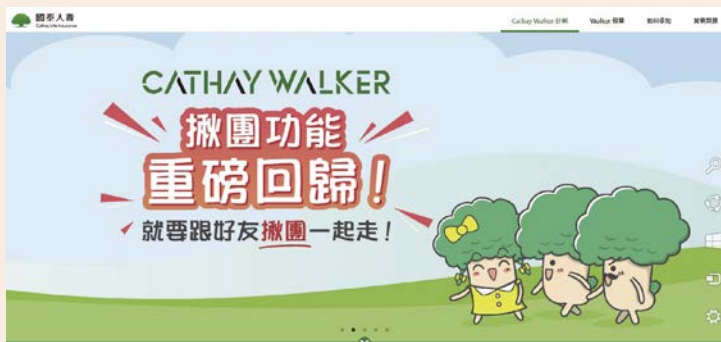
國泰人壽積極打造健康生態圈，導入SROI於「Cathay Walker健康促進計畫」中，鼓勵民眾響應活動走出健康。（圖／截自國壽網站）

竿企業、非營利組織導入SROI這套方法學，建置影響力管理制度，以對專案利害關係人進行訪談以及文獻研究等方法，完整地瞭解，從前端資源投入，到最後成果的動態過程，包括對於終端受助者或其他利害關係人產生什麼改變及影響，並以貨幣化的方式呈現總體的價值，最後送交全球主要推動SROI方法學的英國「社會價值國際協會」（Social Value International）進行第三方認證。