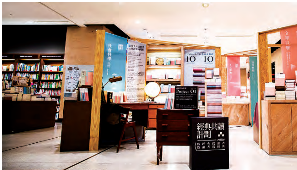
誠品推出「經典共讀計劃」，目標在2年半內推薦500本經典作品。目前2期已攜手20家出版社，推出200本東西方必讀經典作品。

全店擁有超過15萬種書目、50萬冊藏書，其中包含4萬種台版書；除了豐富的書籍，200個台灣陸文化創意品牌亦是亮點。另外，還有蘇州