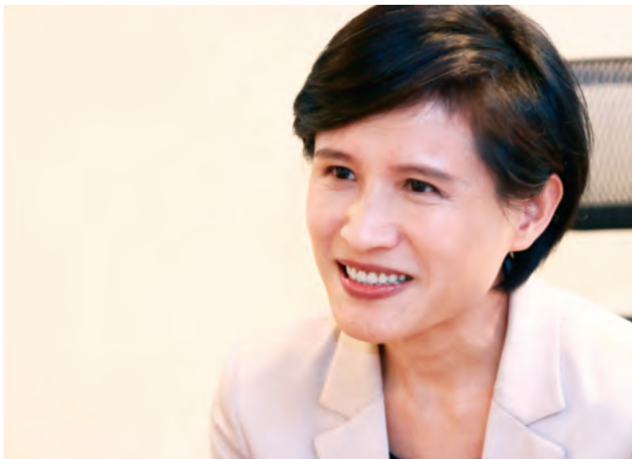
文化部部长鄭麗君期盼，在金融機構支持之下，協助我國文創產業蓬勃發展。