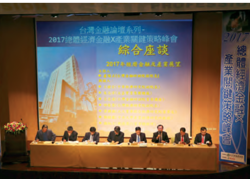
台灣金融研訓院辦理「2017總體經濟金融X產業關鍵策略峰會」，與會盛況空前。

第二，製造業為一國經濟發展根本，目前先進國家的製造業占17%GDP，其中工具機為製造業的基礎。在工業4.0時代，製造業的全球關鍵產業包括工具機與資通訊產業，這兩者台灣都有優勢。第三，併購為取得破壞性創新的策略之一，併購可協助企業快速進入新領域、擴大市場與經濟規模及順利進入新市場的策略目標。以日本為例，積極採取併購手段以尋覓全球市場發展機會，友嘉也是積極採取併購策略，從1989年為全台最小的工具機業者，到2011年成為台灣最大工具機業者，目前則是全球第3大工具機集團。