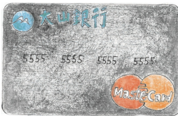
多數百貨公司都和銀行結盟，發行認同卡。