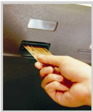
信用卡還可以用來繳交各項公共事業費用。

聽到寶媽說每期帳單都全數付清，寶妹不解的問到：「刷信用卡不就是先刷後付而已，全數付清不是理所當然