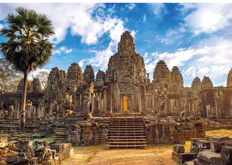
玉山金送愛到柬埔寨，帶著當地孩童領略吳哥窟之美。 (圖/達志影像)