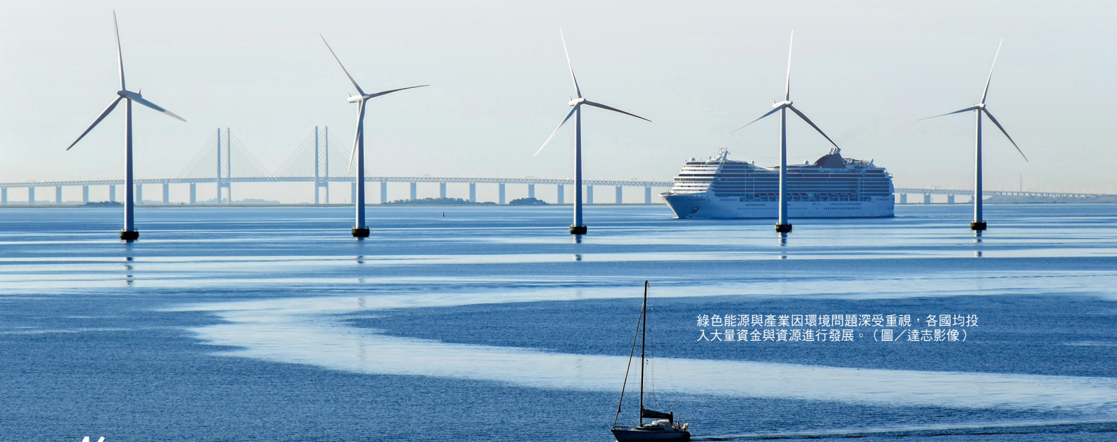
綠色能源與產業因環境問題深受重視，各國均投入大量資金與資源進行發展。

另外，全球金融業在這一波綠色金融的推動上也未缺席，例如澳洲國民銀行（NAB）提供一種創新的再生能源融資機制，讓主要金融機構