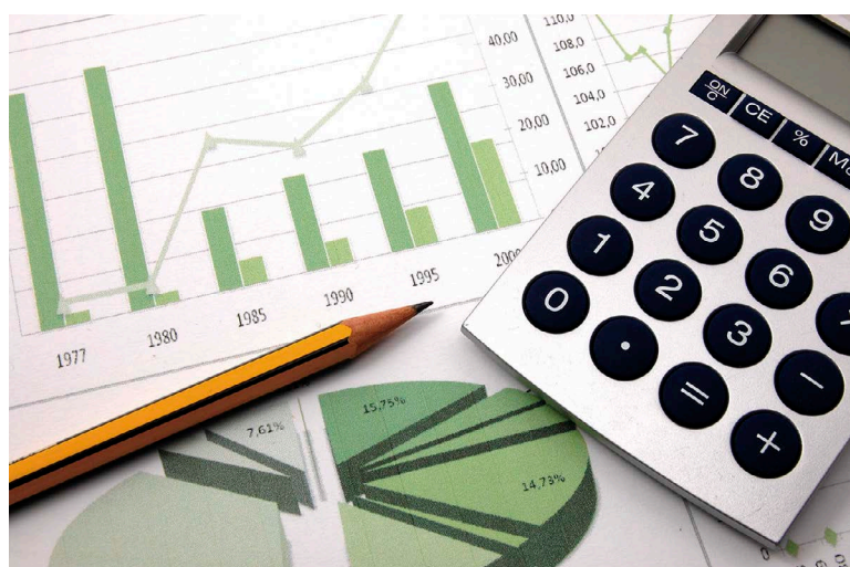
金管會鼓勵本國銀行對含綠能科技的重點產業辦理放款，促進產業發展。

近年來，國際間對永續發展議題日益重視，金管會亦積極帶領周邊單位推動相關措施。2017年12月18日，台灣指數公司（台灣證券交易所子公司）與富時國際公司（FTSE