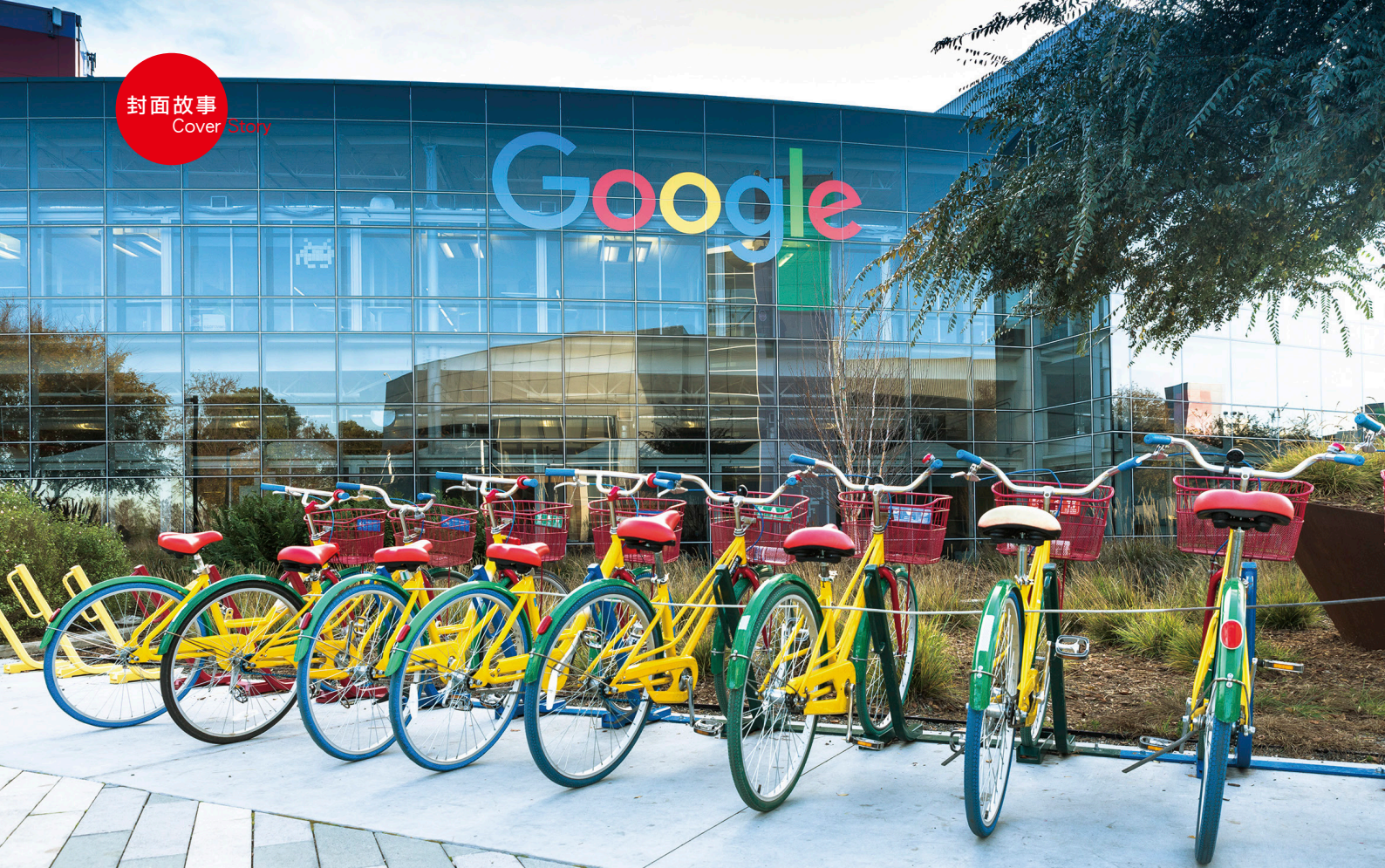
國際企業為了能源永續問題，也紛紛制定購買綠電政策。（圖／達志影像）

而過往大多數的人可能都認為企業只想要便宜的電，不過事實上，現在有很多國際企業為了環境永續問題，而想要使用綠電。國際上有一個RE100聯盟，而目前該組織已獲得140家企業加入，包括蘋果、Google、微軟、NIKE、IKEA、H&M、雀巢、飛利浦、BMW等各行各業龍頭，皆赫然在列，該聯盟原本2014年發起的目標是募集100家大型跨國企業，承諾在2020年前100%使用再生能源，看起來會比原本預訂目標提早達成，RE100便將目標再提高為2020年500家，顯示更多國際級企業注重「綠能議題」。