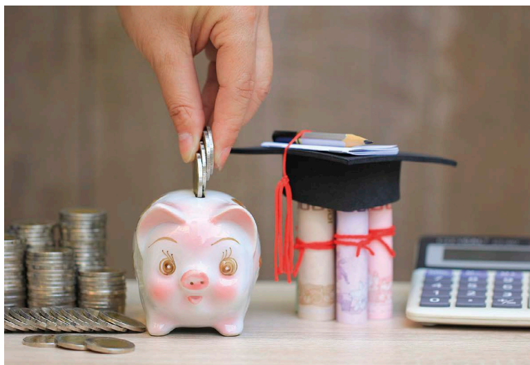
許多歐洲銀行開始設法更全面地與社會互動，推動金融教育即是其中的重要一環。

此外，大公司經常必須公開除了財務以外的其他資訊。長久以來，決策者都很喜歡用企業報告書來檢視公司的表現，因為它可以提高透明度，衡量績效指標表現，讓股東更了解公司的營運狀況。同樣地，它也能讓企業檢視自己實踐了哪些企業社會責任，並以更有系統的方式回顧企業的發展歷程。