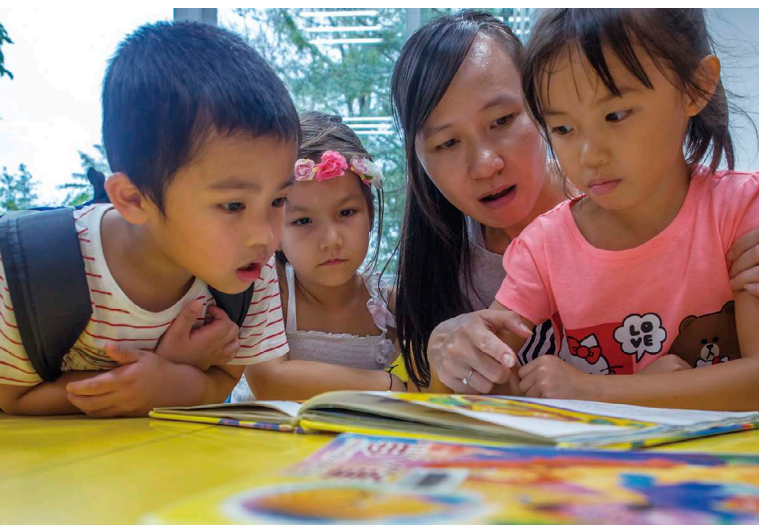
玉山黃金種子計劃，希望提供給學童更優質的閱讀環境，提升偏鄉教育的資源。

然而，對企業社會的責任，光憑爆表的愛心終究無法永續經營，對此，玉山以「3i」——創新力（innovation）、整合力（integration）、影響力（influence）做為推動CSR的核心原則。黃男州說，創新力即企業結合自身能力及資源，以創新的方法推動CSR，如玉山透過信用卡的發行，推動設立偏鄉小學圖書館；整合力，即企業本身外，更整合員工、顧客等多方資源；影響力則是考量CSR活動的推動是否會帶給社會正向的影響力。