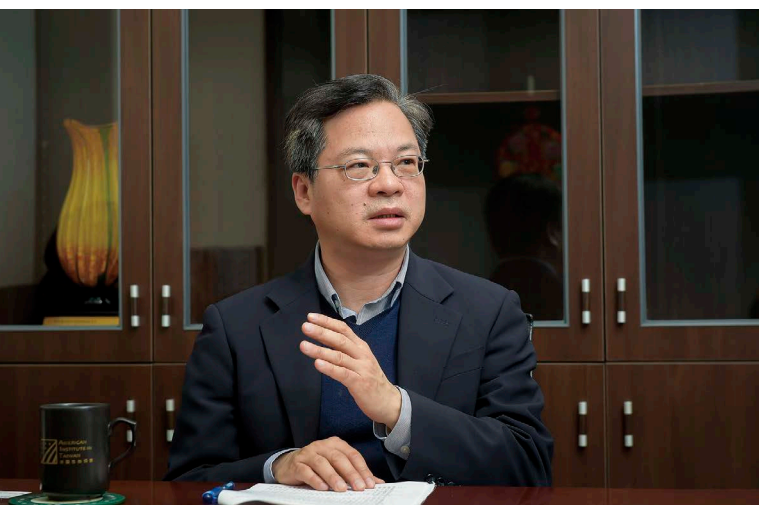
行政院政務委員龔明鑫認為離岸風電專案有穩定現金流，對金融業及投資者來說是很好的商品。