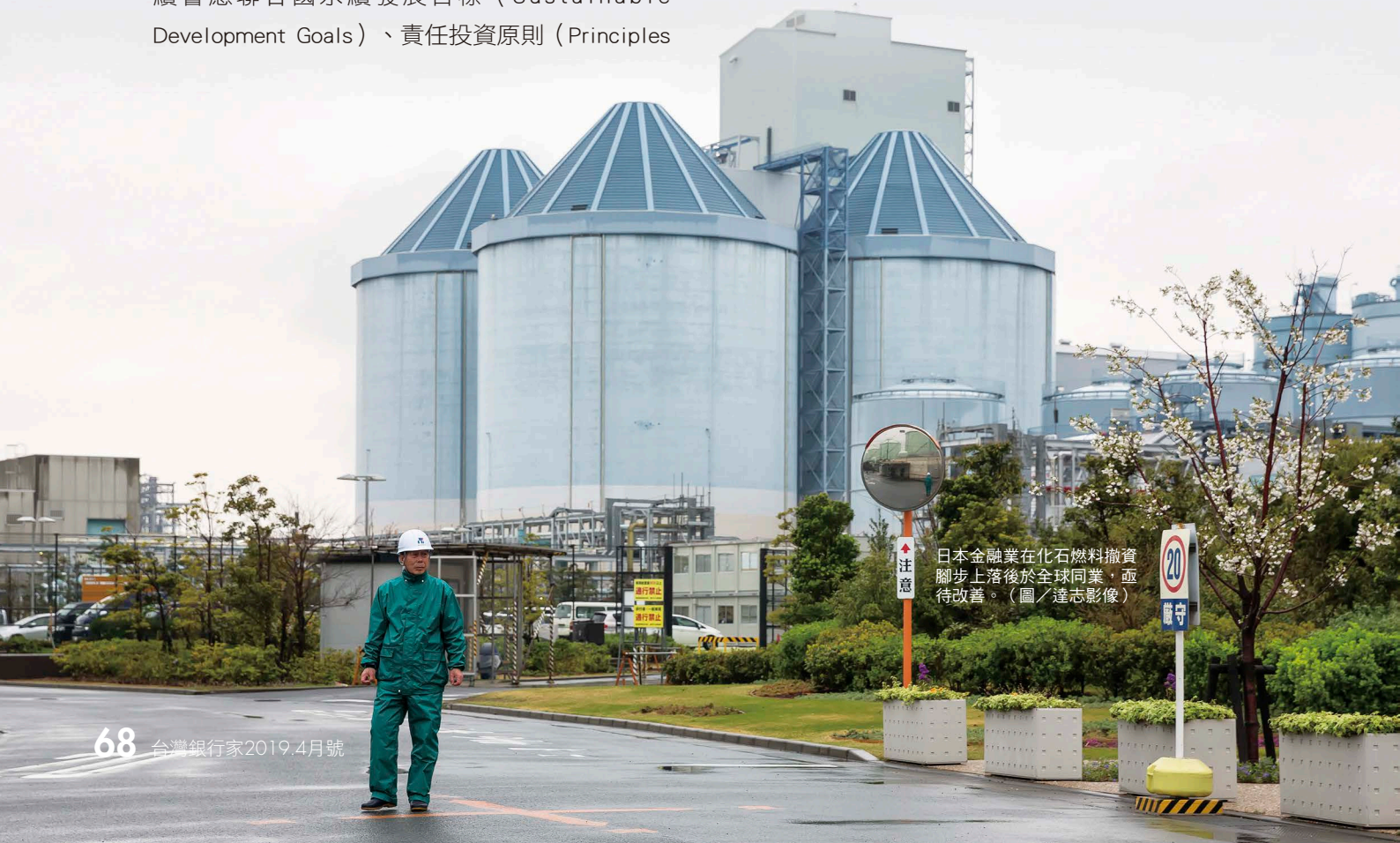
日本金融業在化石燃料撤資腳步上落後於全球同業，亟待改善。

for Responsible Investment）、永續保險原則（Principles of Sustainable Insurance），以及簽署或遵循赤道原則（Equator Principles），將環境與社會風險整合至授信融資過程，針對客戶進行風險調查，避免專案融資對環境與社會產生負面影響，以達到責任放款、永續金融的目標。