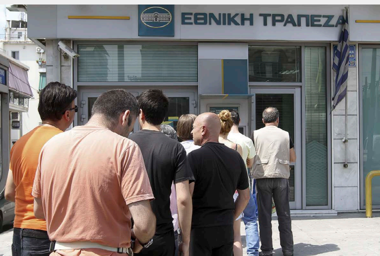
希臘是否退出歐元區的疑慮，曾對全球金融市場造成震盪衝擊。 （圖／達志影像）

2010年4月歐盟、國際貨幣基金及歐洲央行組成三方委員會首次紓困希臘1,100億歐元，5月設置歐洲金融穩定基金（EFSF）規模7,500億歐元，至2013結束；同時歐洲央行開始購入歐元區會員國的公債。11月紓困愛爾蘭850億歐元。2011年5月成立具國際法基礎的歐洲穩定機制（European Stability Mechanism, ESM）7,000億歐元。紓困葡萄牙780億歐元，擴大EFSF的規模。7月第二次紓困希臘，12月德國國會多數決議通過EFSF擴大規模1兆歐元，實行槓桿操作。同時歐洲央行理事會通過執行長期再融資操作（Long Term Refinancing Operation, LTRO），提供523家銀行貸款4,891.9億歐元（約占歐元區GDP的5%），使銀行能支應2012年第一季到期公債再融資的需求。