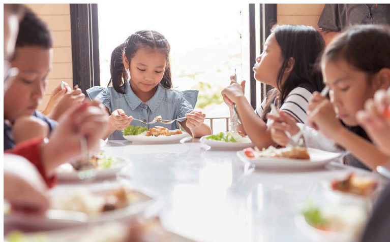
玉山內部推動認養偏鄉學童營養午餐餐費的活動，幫助孩子們健康成長。

為讓學童們在舒適環境中享受閱讀，玉山下足了工夫，如木質地板的設計，改善傳統圖書館給人的僵硬冷冰印象；考量國小學童身高差距，設有低年級閱讀區及中高年級閱讀區；因應影視等活動需求，設有環型劇場，且圖書館牆壁上還有結合學校或當地特色的專屬壁畫等多項貼心設計。同時，為讓圖書館永續發展，除剛落成時所捐贈的千本新書外，玉山每年還提供圖書館維護費用、每2年定期補充書籍、每5年定期的整修翻新服務，足以看見玉山對偏鄉學童教育的重視，以及落實CSR的用心。