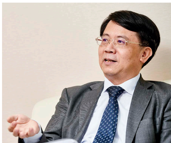
金管會副主委張傳章表示，離岸風電建設屬長期專案融資，亦可促進外銀與國銀共同合作。

針對市場對發行綠色債券額度限制的疑慮，張傳章澄清說，櫃買中心於2017年4月21日公告及施行「綠色債券作業要點」，僅規範發行人就所擬發行債券向櫃買中心申請取得綠色債券資格認可的相關作業，對於相關發行債券額度，並無限制規定。換句話說，發行人所