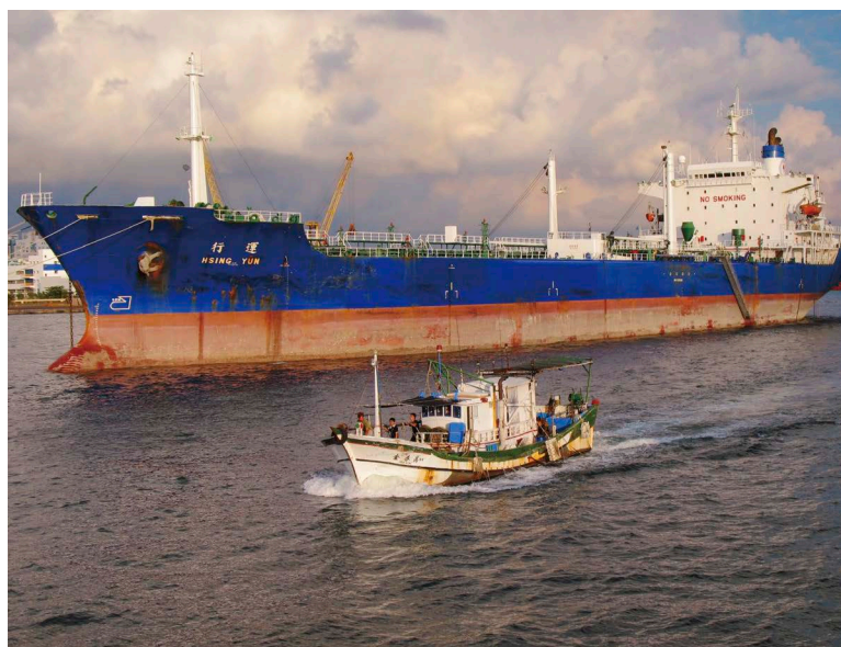
台灣能源進口依賴度高，發展風力、太陽能等綠色發電方式，應可有效降低能源依賴問題。

綠色能源是指再生能源，例如水能、生物能、太陽能、風能、地熱能和海洋能等。這些能源消耗之後可以恢復補充，很少產生污染。相對煤、石油、天然氣、鈾（核能）等不可再生能源，再生能源可於自然界中，藉由生態循環取得再利用且源源不絕之能源。而利用高效率、低污染的能源轉換及利用新技術，便可節能且提升能源效率。