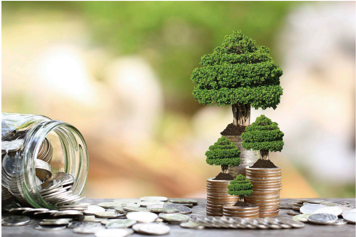
台灣推動綠能政策，除政府支持外，綠色金融也扮演了相當重要的角色。