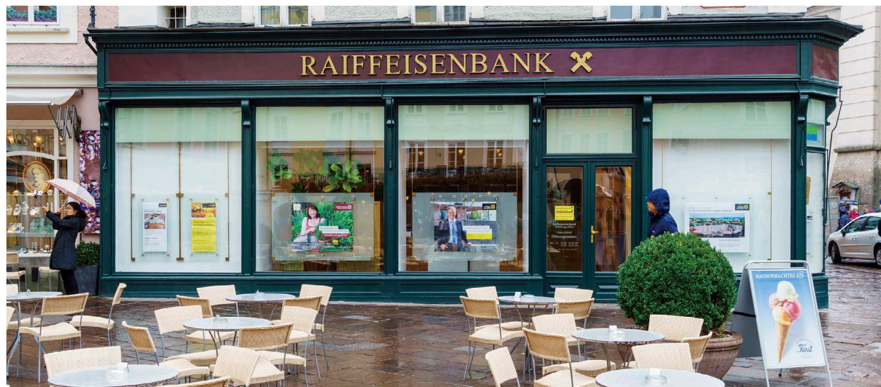
奧地利的銀行，在暑期推出1周的「未來企業家」課程，教導學生如何開發創意、撰寫商業計劃。

至於雇主則經常抱怨年輕人不夠精熟職場上的實作技能，即使資格符合職位的需求，應徵上之後也無法立刻勝任該職位的工作。因此