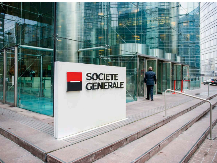
法國興業銀行發行新台幣計價債券，將會用於台灣海洋風電Formosa I 專案融資計劃的部分資金中。