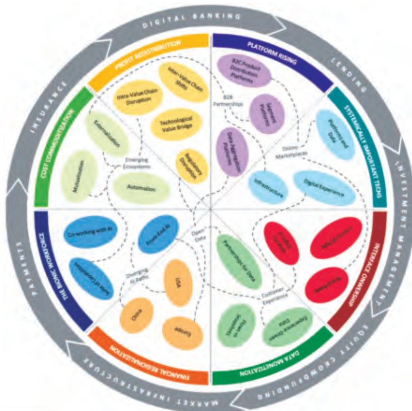
(圖) 金融科技服務產業生態系