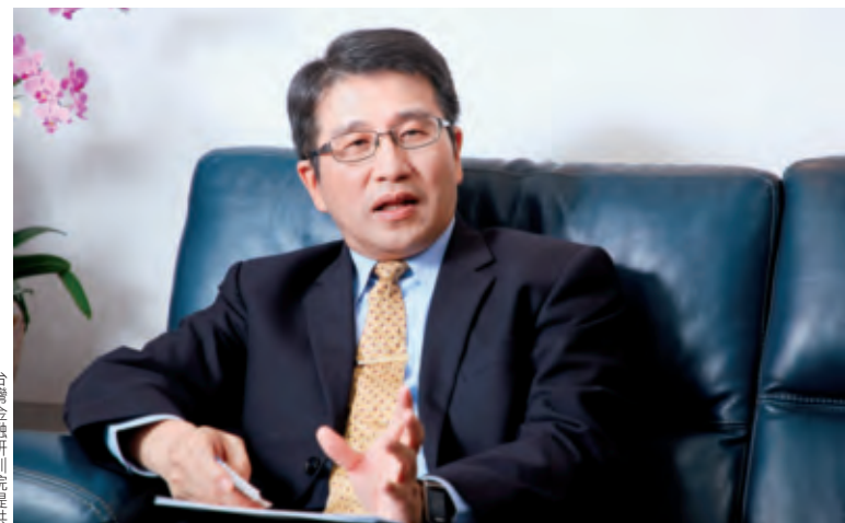
台灣金融研訓院提供

不光是醫院，彰銀亦在肉品市場推出無現金收付服務，彰銀與台南肉品市場合作，落實無現金