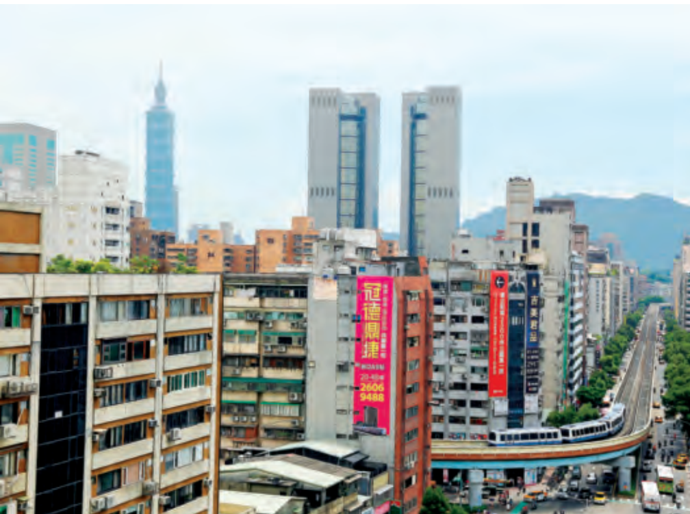
透過都市更新改建，使地狹人稠的土地使用更有效率。

除了中壢黃金地段的行舍都更動工之外，包括一銀的大同分行及延平大樓等2處舊行舍也加緊腳步進行都更。一銀主管進而說明，大同分行的老舊行舍是採與鄰地合建開發方式進行改建，該合