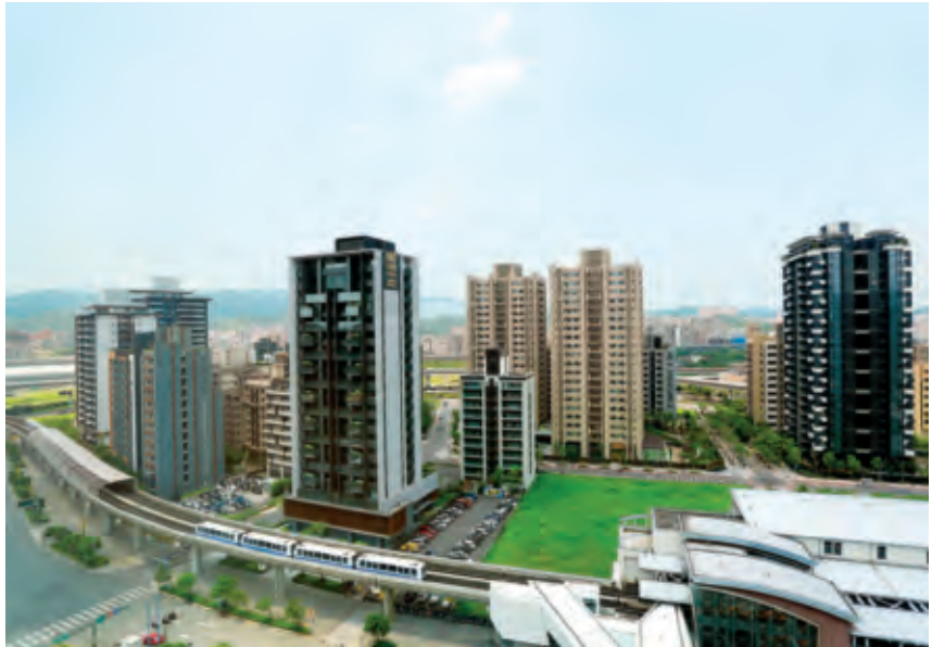
辦理都更改建，將結合相關重大建設、美化沿線景觀。