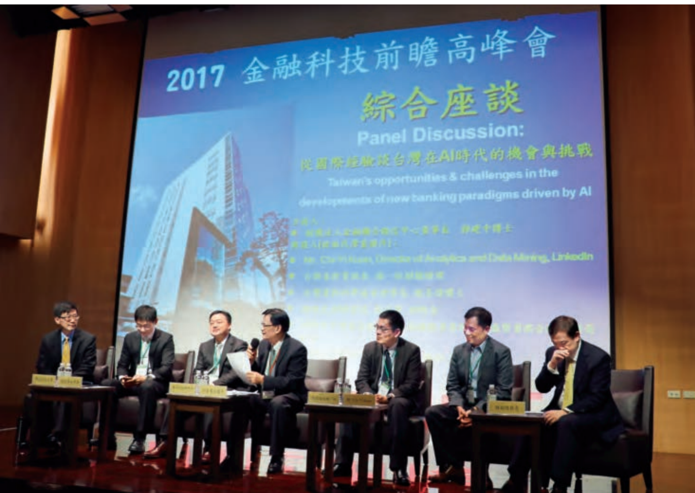
「2017金融科技前瞻高峰會」各界專家齊聚座談。

LinkedIn之所以積極轉型為大數據分析平台, 正是因為看到AI將深切影響人類的未來。身為