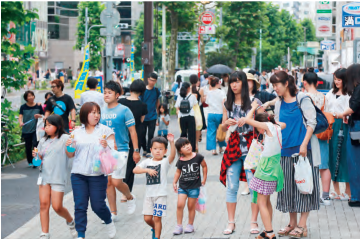
日本社會三代同堂的家庭逐漸減少，孩童失去與長輩相處的機會。

近年來，社會三代同堂的家庭減少、轉以核心家庭為主，孩童失去與長輩相處的機會。透過與高齡者互動，實際聆聽以前的歷史文化、禮儀教養，孩童自然而然習得「人生態度」、「生活智慧」、「體貼別人」等。對